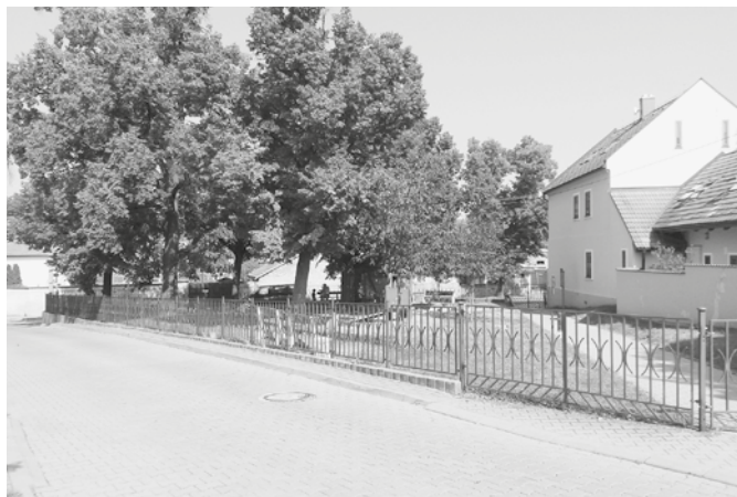
Náměstíčko u Křížku