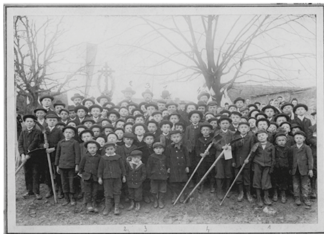
Historické foto ►

Pozoruhodná je rychlost vyhloubení. Zastupitelstvo o zakázce rozhodlo 4. února 1901 a v červnu téhož roku byla studna veřejnosti předána. Dlouhá léta pak byla udržována a sloužila až do zavedení veřejného vodovodu.