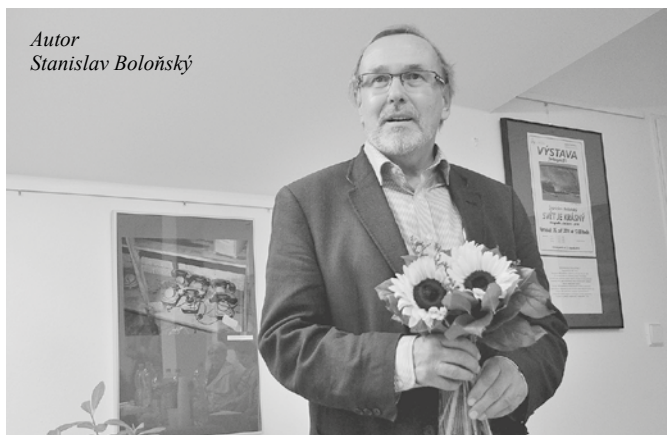
Autor Stanislav Boloňský