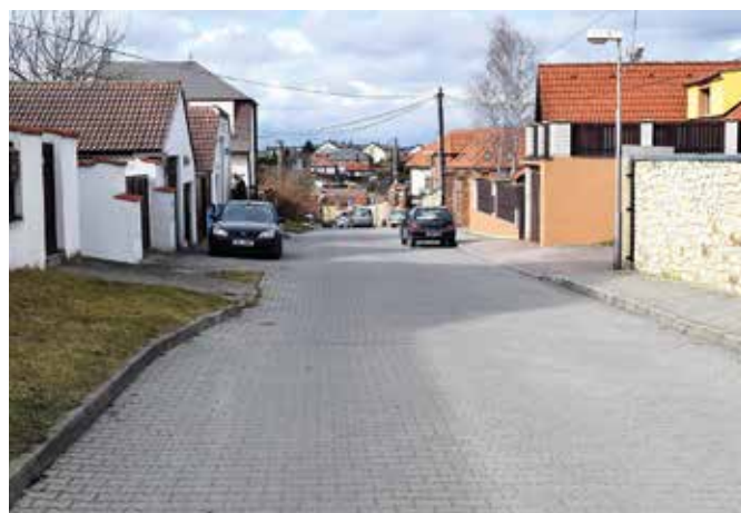
Ulice Spojovací dnes

Některé objekty poblíž křižovatky s nynější ulicí Hrdinů dlouho tvořily s touto ulicí a s ulicí Přímoú přírozené centrum obce. Vezmeme-li to od objektu nynější lékárny, tak tam byla druhá nej-