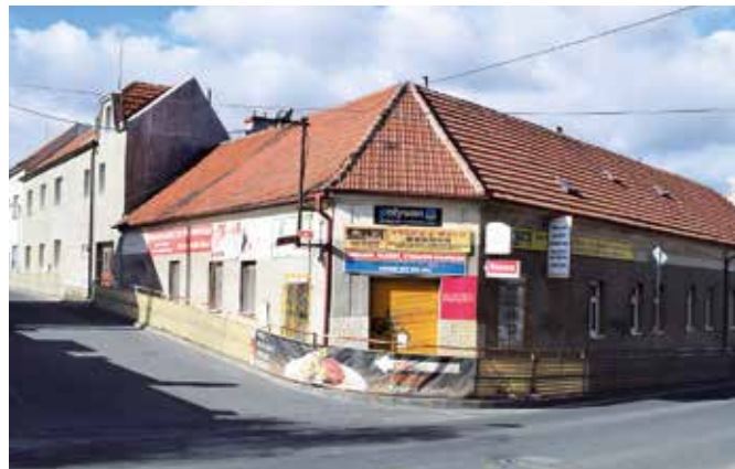
Roh Spojovací a Hrdinů dnes

Mezi Kamenicí a Humenicí existovala v určitém období značná řevnivost, kterou ještě mnozí starousedlíci pamatují. Je ale za-