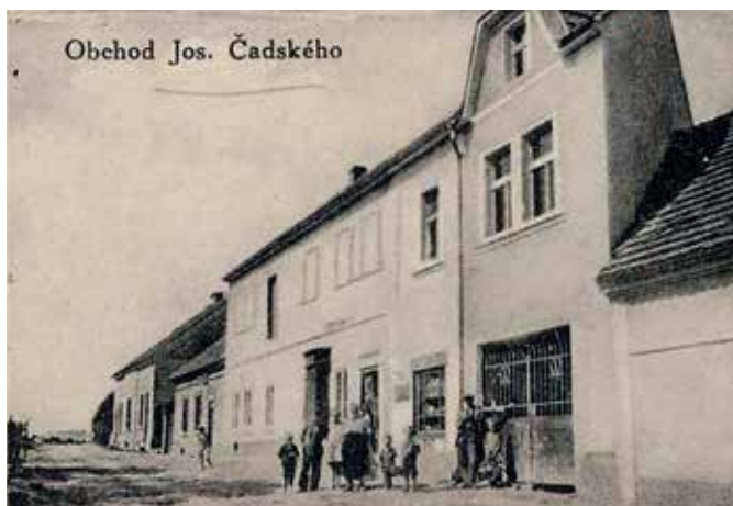
Ulice Spojovací – r. 1937

Cepem otáčeli všichni mlatci jedním směrem, aby se jim bijáky ve vzduchu nesrážely. A srážet se nesměly ani na mlácených klasech. Proto museli mlatci udržovat rovnoměrný střídavý rytmus.