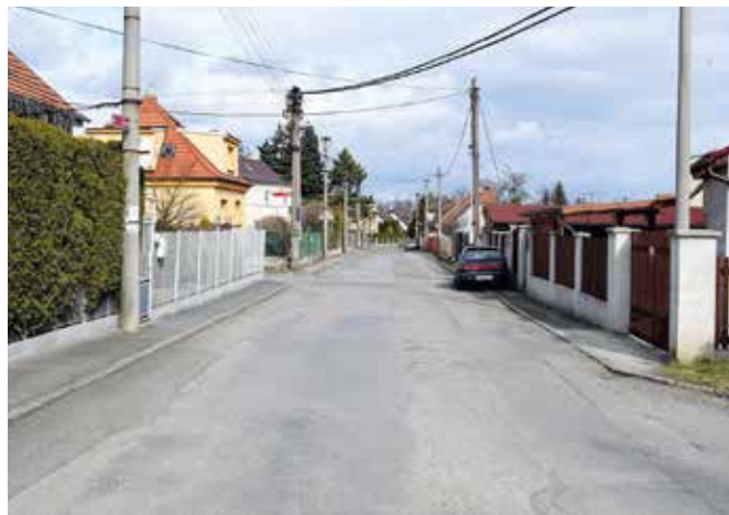
Ulice za Humny

Touto ulicí a souběžnou ulicí Konzumní se jezdilo a chodilo na většinu pozemků k lesu a za roklemi a také do lesa. Ten dříve do horoměřického katastru nepatřil, ale změnou hranic v roce 2004 se podařilo připojit ke katastru Horoměřic 20 hektarů lesa a následně získat do vlastnictví obce čtyři lesní cesty.