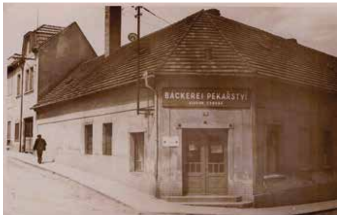
Roh Spojovací a Hrdinů – r. 1940

Jak ale většina čtenářů jistě ví, je humno synonymem slova mlat, tedy místa, kde se cepy mlátilo obilí. A to ještě dlouho poté, co se cepy přestali mlátit křížáci. Uvedený způsob výmlatu končil v našem kraji přibližně před sto léty zaváděním různých mlátiček. Do té doby probíhala sklizeň tak, že se obilí svezlo do stodoly, která měla proti sobě dvoje vrata. Z jedné strany se s potahem vjelo a obilí se složilo na jednu stranu stodoly. Druhou stranou se