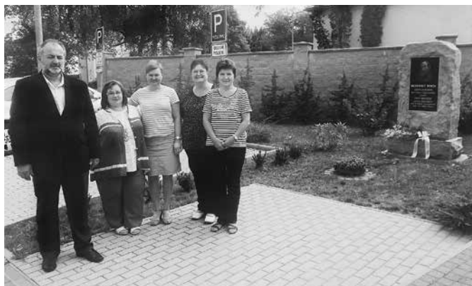
U památníku v Horoměřicích

Již dva roky navíc stojí před obecním úřadem nový památník, který Roezla připomíná. Nejprve jsme tedy položili kytici orchidejí k tomuto památníku za účasti starosty a zaměstnankyň obecního úřadu. Orchideje volíme proto, že právě Roezl má velkou zásluhu na tom, že se orchideje v 19. století dostaly do Evropy a získaly zde velkou popularitu.