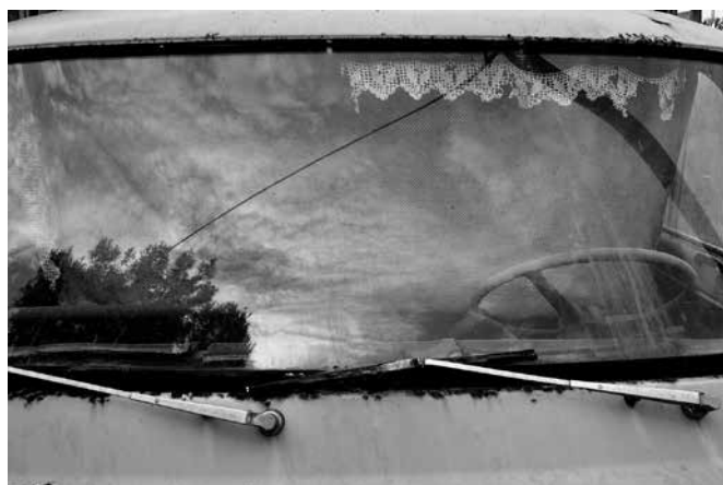
Z cyklu Vehikl 2016