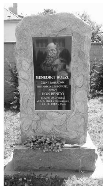
Památník B. Roetzla v Horoměřicích