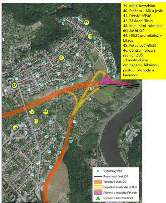
Obrázek 2.8: Umístění referenčních bodů v okolí MÚK Rybářka